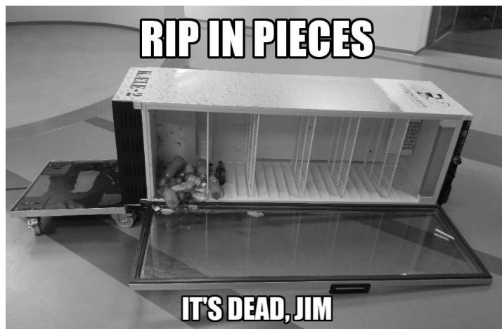
Figur 1: R.I.P. Kæle-2 (?-2015)